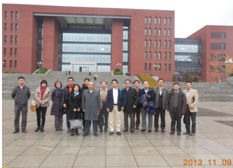
大連理工大学にて