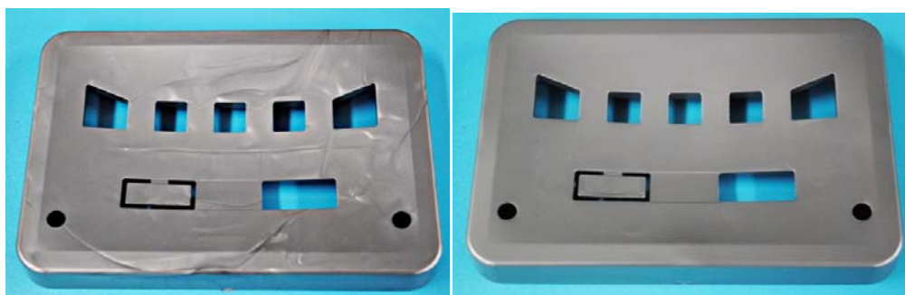
図2 富士精工によるウェルドレスメタリック成形品と対照品